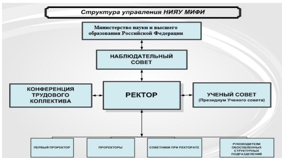
Рис. 1.3.1. Структура управления университетом

Каждая САЕ имеет свою стратегию развития, скоординированную с общей стратегией развития университета, и является самостоятельной в принятии решений в рамках своей деятельности. Ниже приведена структура управления Университетом.